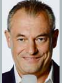
Markus Höhner > (SPORT1-Kommentator)